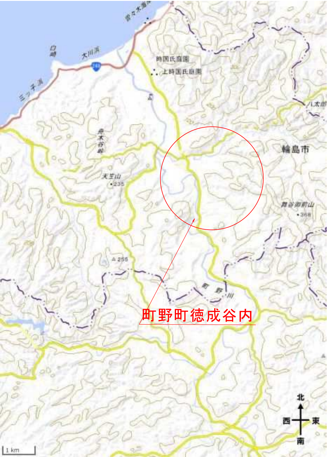
石川県 輪島市 町野町徳成谷内 地内